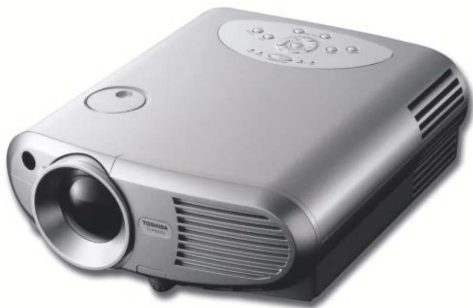
TLP 260 / TLP 560